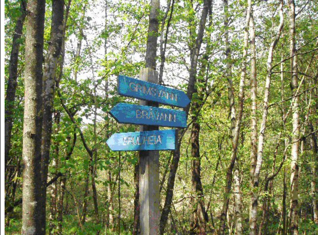
Skilting som resultat av samarbeid mellom Kristiansand kommune og frivillige organisasjoner.

Et tidlig vern av bydelsmarkene i Kristiansand hadde bakgrunn i sikring av vannreservoarer for byens befolkning og et tidlig fokus på naturen som helsebringende for arbeiderne og ikke minst soldatene i byen. På tross av en kombinasjon av offentlig og privat eiendomsrett har bydelsmarkene både her og andre steder hatt status som befolkningens "allmannseie", for mange forbundet med friluftsliv som turer i skog og mark sommer og vinter.