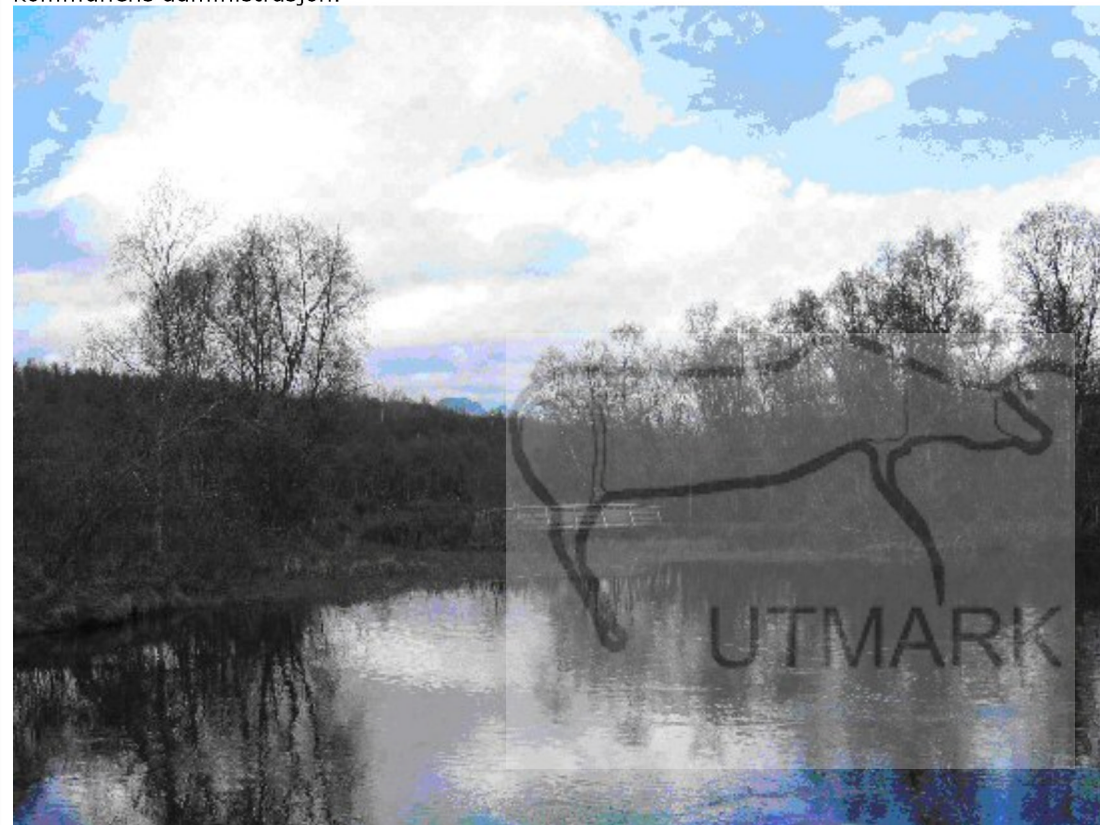
Bodomarkas Venner gjør en stor frivillig innsats i Bodomarka. Blant annet lages klopper, det settes ut benker og det lages gapahuker.

Bodø kommune har nylig gjennomgått en omorganisering som innvirker på friluftslivsforvaltningen i stor grad. Kommunen har nå et 0-budsjett for driftsdelen av friluftsområdene, og ansvaret for disse er også delt mellom avdeling for oppvekst og kultur og teknisk avdeling. Det er ennå for tidlig å si om dette innvirker på kommunens fokus på friluftslivsområder, men et viktig inntrykk er at friluftslivsforvaltningen i Bodø møter store begrensninger i kommunale ressurser, både økonomisk og personalmessig. Informanter i studien (representanter for lokale lag og foreninger, politiske partier og regionalt forvaltningsnivå) har noe ulike oppfatninger av hvem som har ansvar for friluftslivet i kommunens administrasjon.