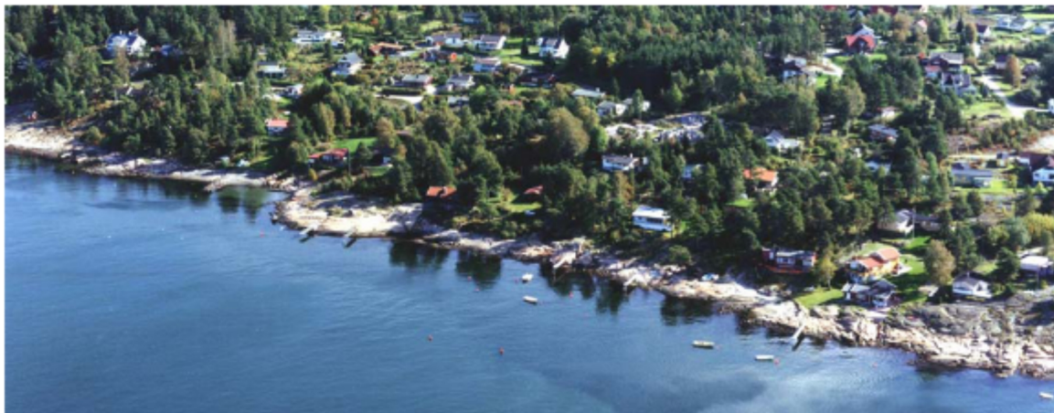
Figur 2. Utsnitt fra strandsona på Saltnes. (Bilde fra Hindhamar AS, Landskapsarkitekter MNLA 2005: Stedsanalyse Saltnesområdet, Råde kommune).

Studien, som er finansiert av Norges Forskningsråd (Program Miljø 2015) omfatter også kvantitative spørreundersøkelser blant fastboende, hyttefolk, dagsbesøkende og campinggjester på Rubingen Camping (Wold m.fl. in prep.). Disse undersøkelsene supplerer de kvalitative dataene.