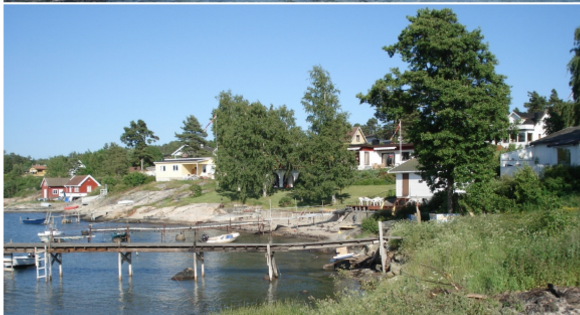
Figur 3. To typiske utsnitt fra strandsona på Saltnes.